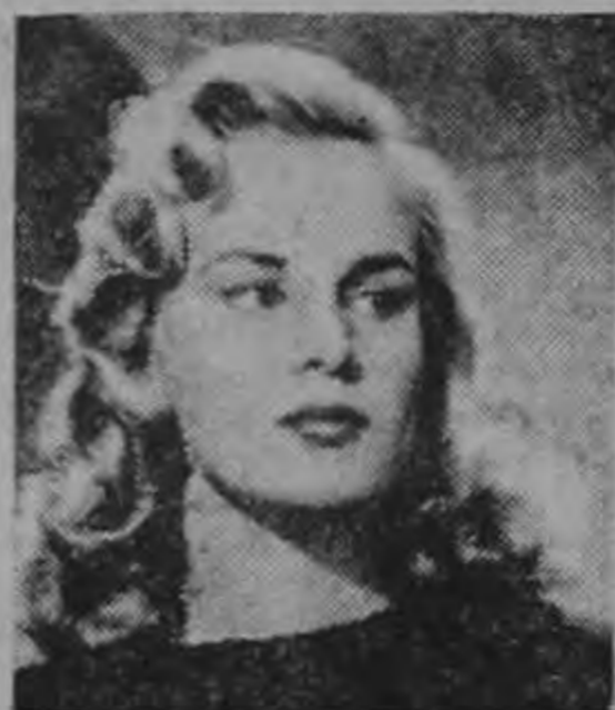
DADA-DADA & Co.

Un drama que ninguna mujer debe dejar de ver porque encierra una sinceridad acusadora y un juicio severo de la sociedad!