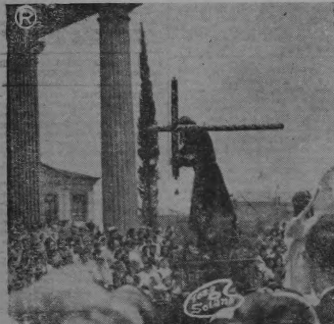
SEMANA SANTA EN SAN JOSE. —Dos aspectos de los actos religioso-católico que se efectuaron en nuestra ciudad capital, con motivo de la celebración de los Dis Santos en que la ciudadanía toda, con devoción y singular sentido cristiano, hizo patente su fe.