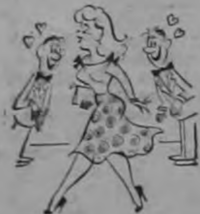
Mas tomó el grato Neuro Fosfato, * y goza plena vitalidad!