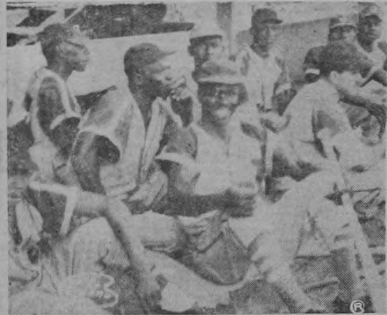
CELEBRANDO LA VICTORIA. —Los integrantes del equipo de Limón, celebran sonrientes la indiscutible victoria conseguida sobre la novena campeona de San José.