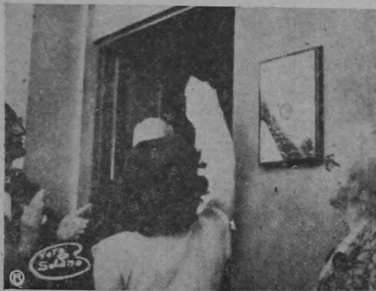
Una distinguida señorita en el momento en que develaba la placa que dió por inaugurado uno de los salones del Sanatorio de Las Mercedes; acto que tuvo lugar en el día de ayer, en horas de la tarde.

DARA GRATUITAMENTE VACUNA SALK Dicho servicio será prestado a los hijos de los asegurados con pólizas de vida, que así lo requieran. Es esta una valiosa colaboración de esta Institución que de esa forma está ayudando a proteger a nuestra infancia (TEXTO EN PAGINA 3)