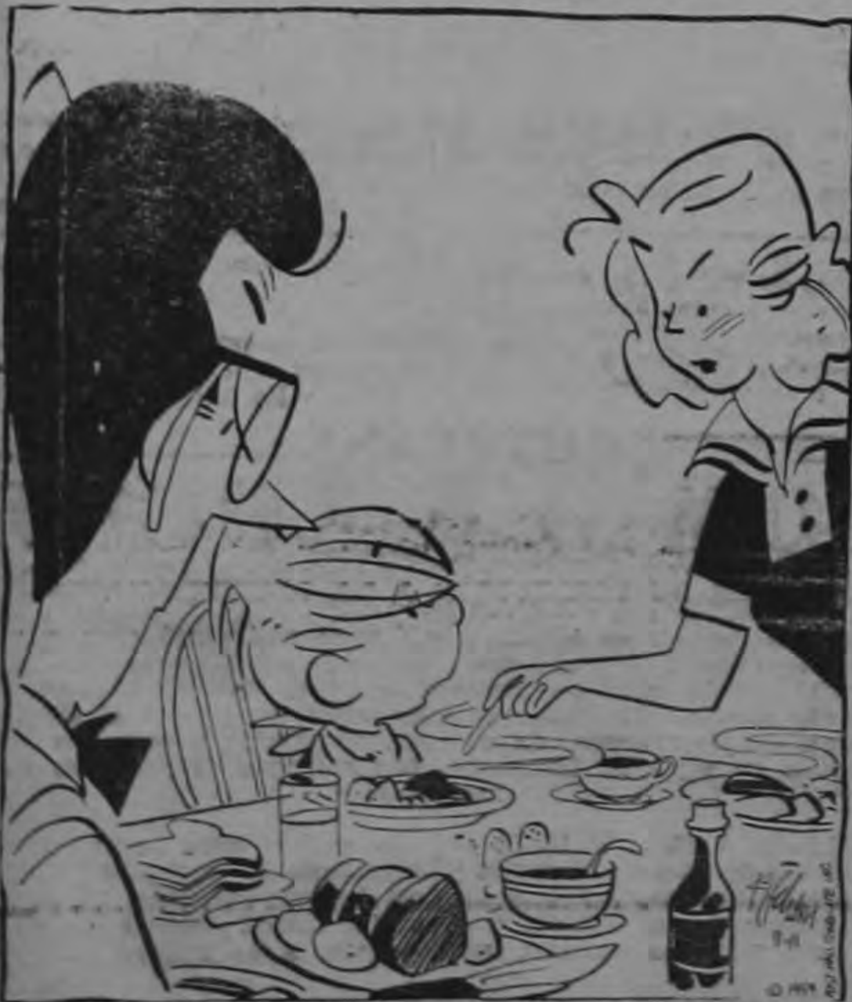
—Perdi el apetito en la cocina de la casa de enfrente...